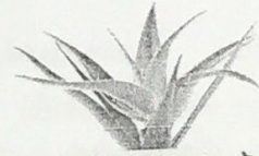
ต้นว่านหางจระเข้