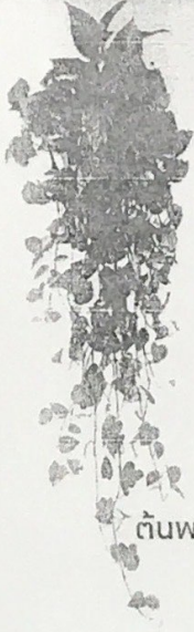
ต้นพลูด่าง