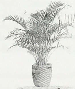
ต้นหมากเหลือง