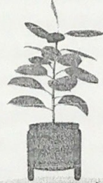
ต้นยางอินเดีย