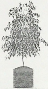
ต้นไทรย้อยใบแหลม